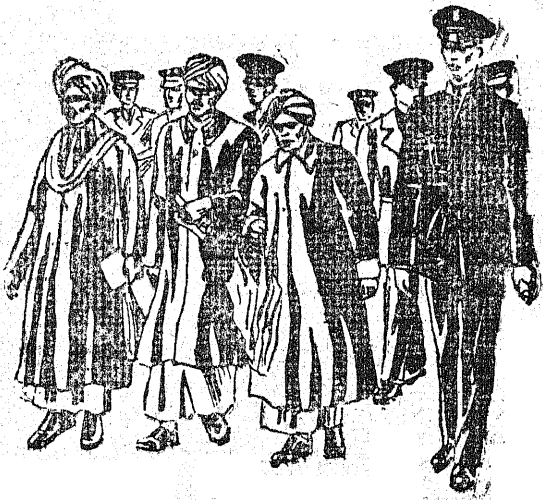
Demonstracja Armji Zbawienia na ulicach Londynu, przeciwko zarządzeniom brytyjskim w Indjach. Na czele pochodzi kroczyli członkowie hindusi

W każdym razie poszczególne koła międzynarodowe czekają w najbliższym czasie nową „sensacją” a to w formie „novialu” dr. Jespersena.