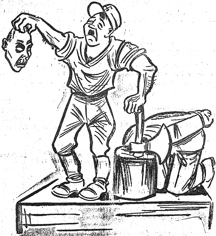
Wkradzie do władzy ponad głowami swoich wrogów