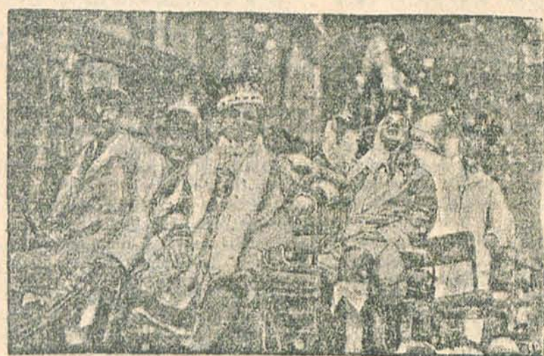
Tak wyglądał tegoroczny król nicyjskiego karnawału. A jak będzie wyglądał król karnawału łódzkiego?

W PONIEDZIAŁEK DNIA 20 LUTEGO w Sali Filharmonii