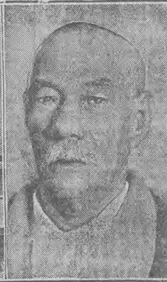
Konflikt angielsko-egipski: 1) Zogul pasza, dymisjonowany premier; 2) Król Fuad przechadza się w ogrodzie pałacu swego z Zogul paszą; 3) Król Fuad.