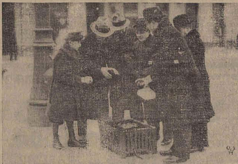
Zarząd miasta zainstalował na ulicach piece, z których ludność skwapliwie korzysta, ogrzewając się.

Zupełnie nieoczekiwanie, gdyż nawet niezapowiadane przez PIM-a przyszły silne mrozy, jakich nie notowano jeszcze w ciągu tegorocznej zimy.