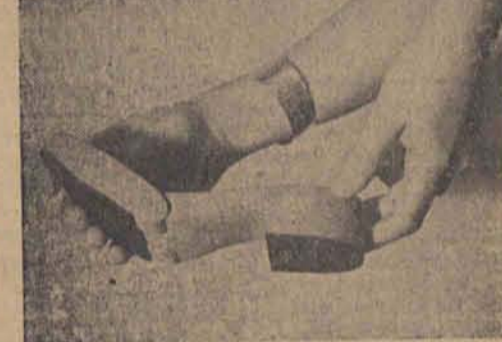
Auf der Reichsmesse Leipzig Diese neuartige biegsame Holzsohle wird von der Damenwelt begrüßt werden. (Presse-Hoffmann)

Prag, 2. September Seit einigen Tagen machen sich in den Abendstunden in Prag in der Nähe der Moldau derartig große Schwärme von Eintagsfliegen bemerkbar, daß man kaum einen Schritt weit sehen kann. Morgens sind die Straßen am Ufer dicht besät mit toten Insekten, die mit Besen zusammengekehrt und dann in die Moldau geschaukelt werden, sehr zum Mißvergnügen der Prager Angler, da die Eintagsfliegen Lederbissen für die Fische sind, die sich nach diesen reichlichen Mahlzeiten dann selbst für den fettesten Angelfischer nicht mehr interessieren. Die Straßen „verwehungen“ durch die toten Eintagsfliegen machen sich auch im Kraftwagenverkehr unangenehm bemerkbar. Neulich geriet aus diesem Grunde ein Auto ins Schleudern, wobei nur mit Mühe ein Unfall verhindert werden konnte.