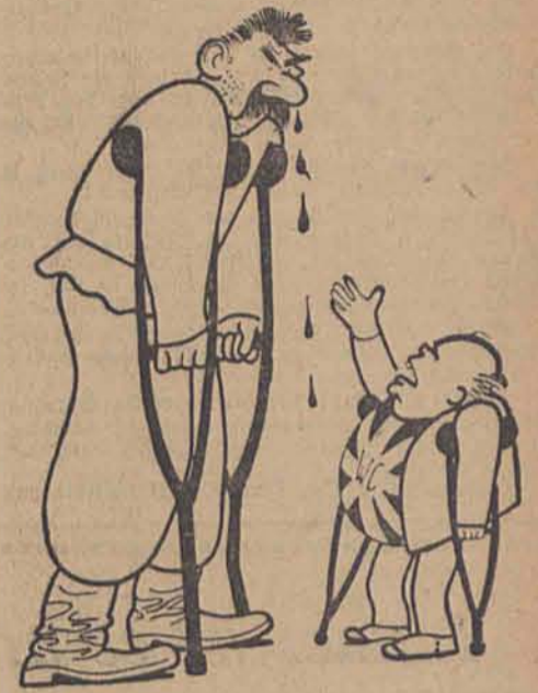
Nur Mut, Kollege Stalin! England steht Ihnen zur Seite!