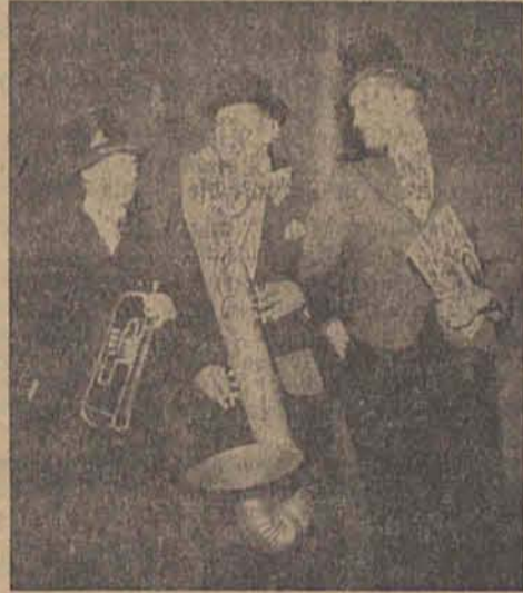
Die drei Musikhumoristen (Brioataufnahme)

Abende, und viele werden recht angenehm enttäuscht den Saal verlassen haben. Wir müssen dankbar sein, daß gerade Verwundete uns diese Entspannung zuteil werden ließen, obwohl sie lieber wieder an der Front wären, wie man aus dem Geist dieser Jungen schließen konnte. Aus diesen Veranstaltungen können auch wir in der Heimatfront immer wieder nur auf unsere Wehrmacht das größte Vertrauen setzen, denn wer diesen Humor hat, wird auch den Mut haben, im Kampfe Mann für Mann den ganzen Kerl herauszufechen.