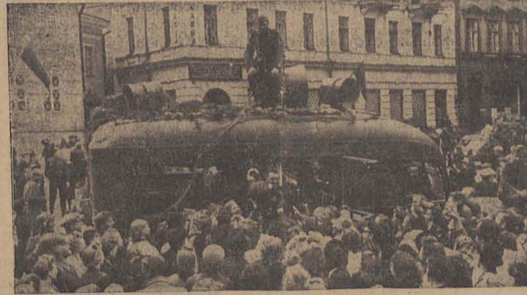
Mit den ersten deutschen Truppen sind auch Lautsprecherwagen einer Propagandakompanie nach Reval gekommen, die neben musikalischen Schallplattenübertragungen auch Aufrufe an die Bevölkerung bekanntgeben