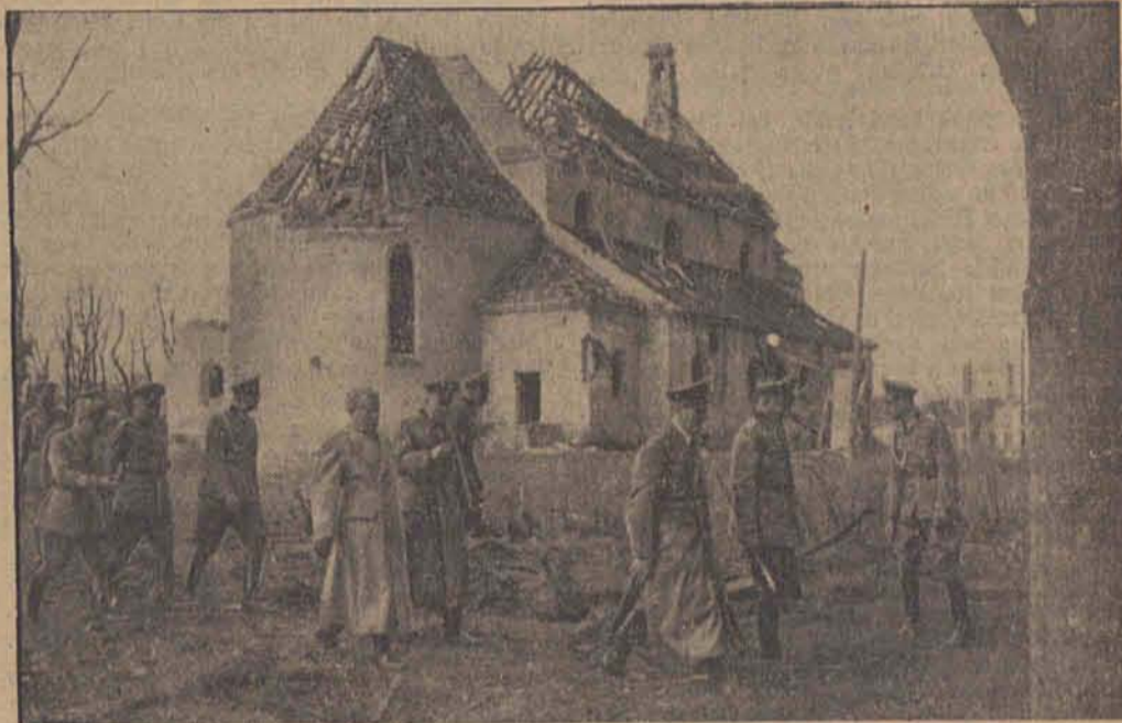
Der Führer mit dem Duce an der Ostfront

Im Kampf gegen Großbritannien bombardierte die Luftwaffe in der letzten Nacht den