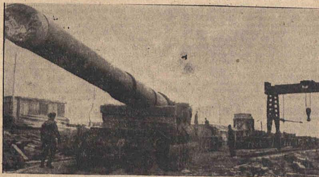
Schwere Fernkampfbatterien der Kriegsmarine an Norwegens Küste Der Transport ist beendet, die Baustelle erreicht, bald wird das Riesengeschütz eingebaut sein