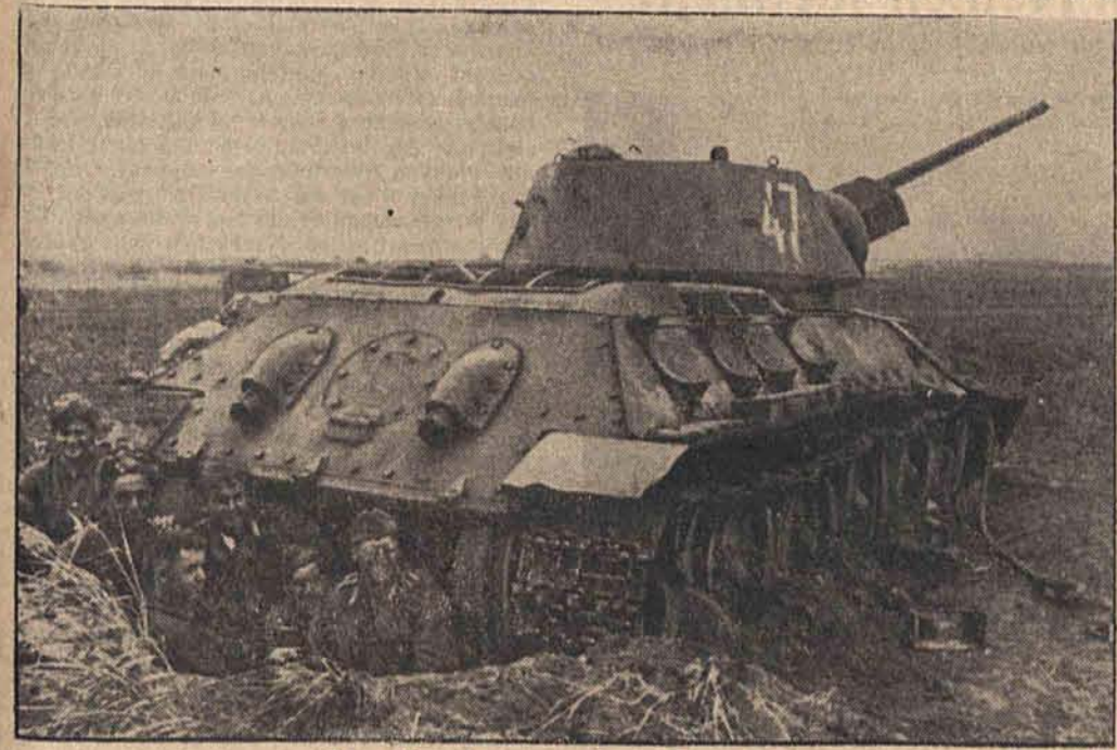
Vom Kampf unserer Panzer-Grenadiere

Unter einem südlich Orel erbeuteten „T 34“ haben sie sich rasch einen bombensicheren Unterstand gebaut, der sie vor dem Artilleriefeuer des Gegners schützt.