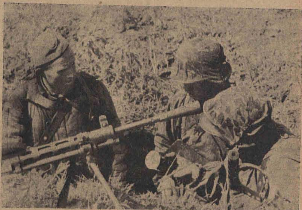
Ein Kampfbild aus der großen Sommerschlacht. Er ergab sich, als die 44-Grenadiere überraschend in seinen Graben sprangen. Der Kommissar seiner Kompanie hatte sich beim Herannahen der Deutschen erschossen

Wie die Sowjetagitation der Welt verkündet, wurde dem Sowjetmarschall Schukow auf Grund eines Erlasses des Präsidiums des obersten Rates der Sowjetunion für hervorragende Verdienste in der Kriegführung der „höchste