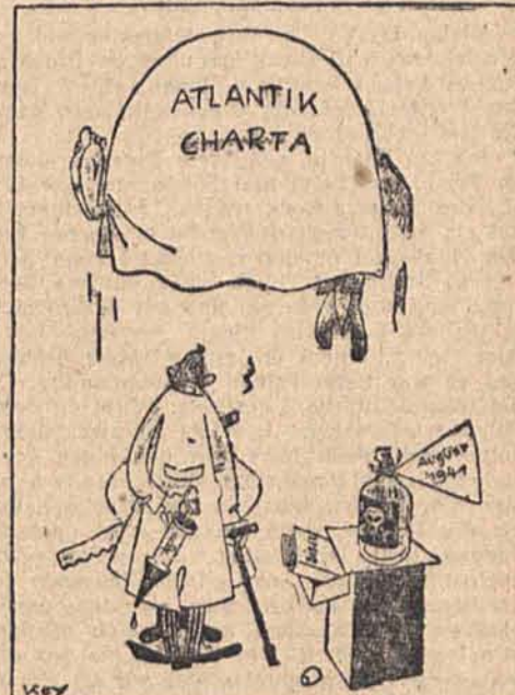
Karikatur: Key/Dehnen-Dienst „Operation gelungen“ — Patient tot!