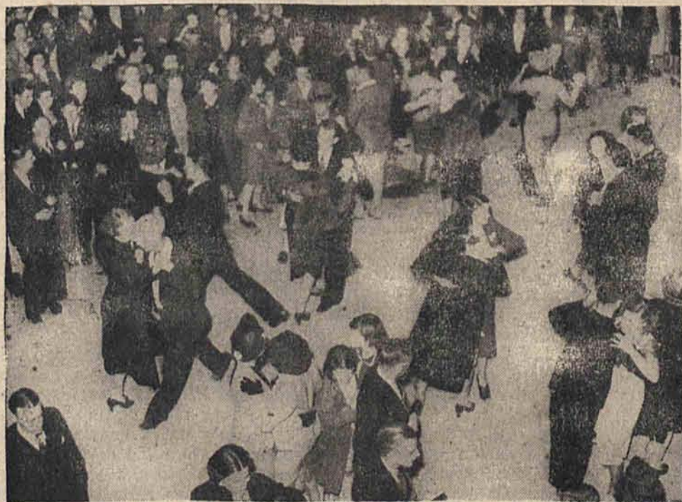
Na zdjęciu fragment konkursu „swingowego“ na jednym z dżancingów amerykańskich.