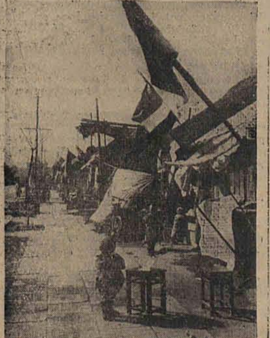
Aby pozyskać sympatie Chińczyków, Japończycy starają się zapiekiwać opuszczonymi domami i dziećmi chińskimi. Na zdjęciu widzimy szereg takich schronisk dla uchodźców w Nankinie.