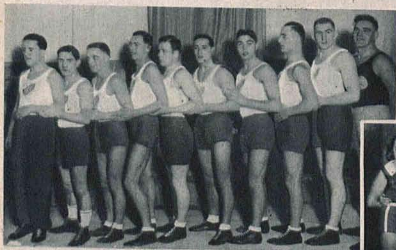
Na lewo: Zespół pięściarski IKP jest najpoważniejszym kandydatem do tytułu mistrza Polski.