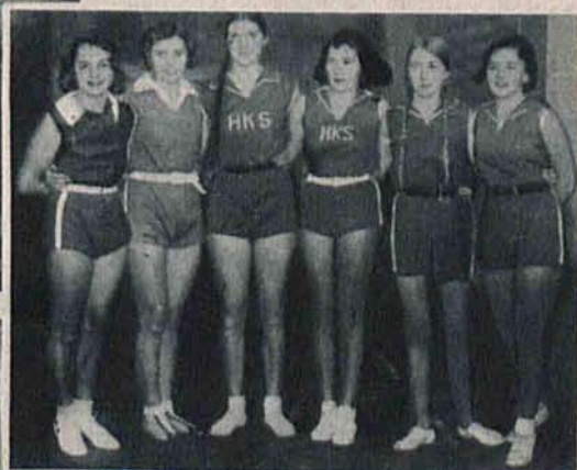
Dośkonaty zespół siatkówki HKS zwyciężył w turnieju Triumfu drużynę ŁKS-u.