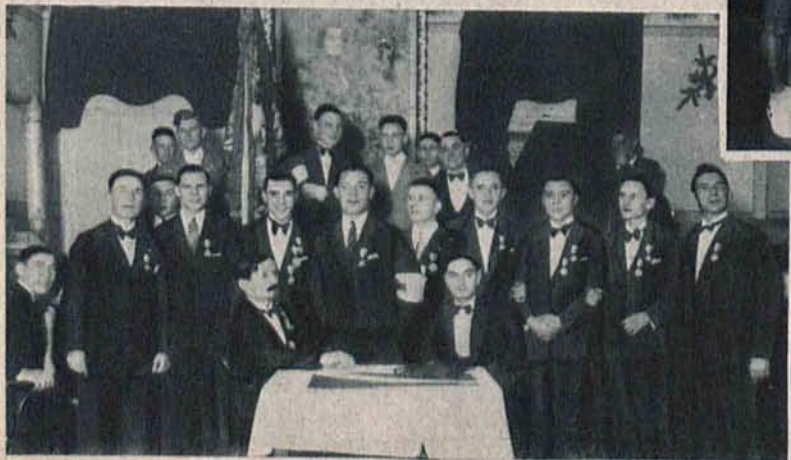
Na lewo: Uroczyste rozdanie nagród sekcji kolarskiej ŁKS.