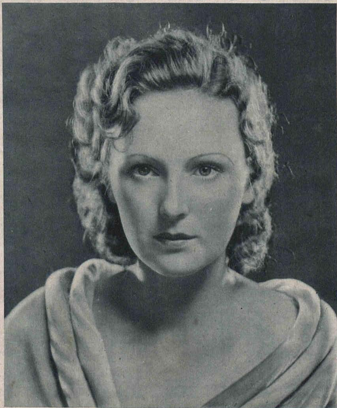
Dorothy Jordan, jedna z najpiękniejszych gwiazd filmowych świata