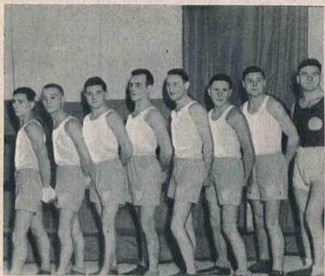
Zespół bokserski Wawelu krakowskiego odpadł w półfinale mistrzostw Polski, przegrywając w wysokim stosunku w Łodzi.