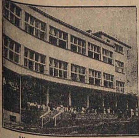
Ubezpieczalnia Sp. w Bielsku Kolonia w Jaworzu.

W ramach letniej akcji wypoczynkowej dla dzieci, która już za parę tygodni rozpocznie się na terenie całej Polski, Ubezpieczalnie Społeczne przewidują w tym roku dalszą rozbudowę własnych kolonii i pół-kolonii. Zalecenia Zakładu Ubezpieczeń Społecznych idą po linii jak największego ich rozwoju i dążenia do stopniowego wzrostu posiadania własnych terenów kolonijnych oraz budowania domów, specjalnie przystosowanych do potrzeb kolonii i pół-kolonii.