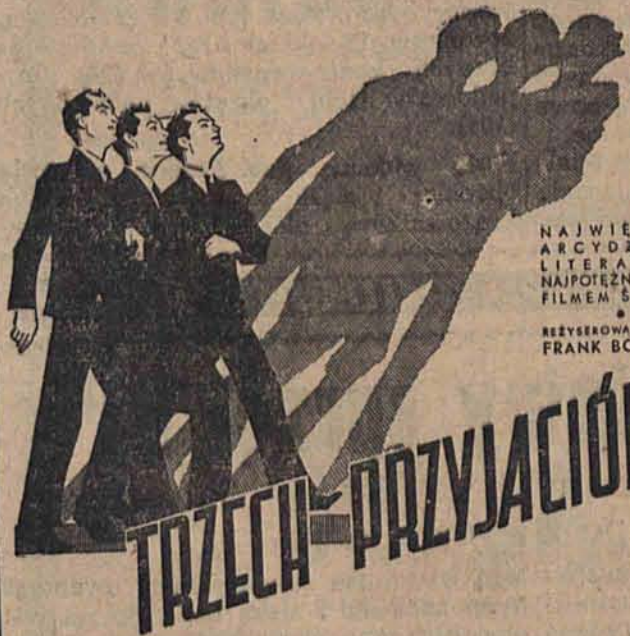
NAJWIĘKSZE ARCYDZIEŁO LITERATURY NAJPOPIĘKNIEJSZYM FILMEM ŚWIATA! REŻYSEROWAŁ GENIALNY FRANK BORZĄGE

Sytuacja przedstawia się więc w ten sposób, że „Siegfried” jest zalany, a „Maginot” wytrzymał próbę czasu i przedłuża się w obydwie strony.