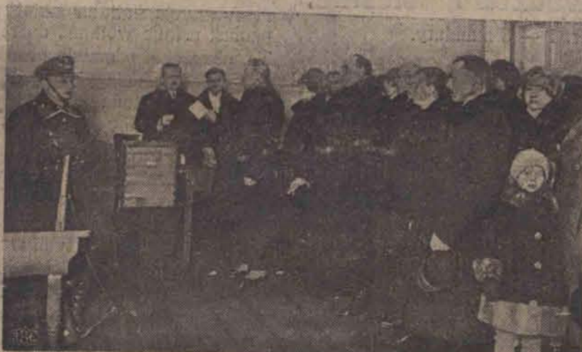
Fragment z wczorajszego głosowania do senatu.