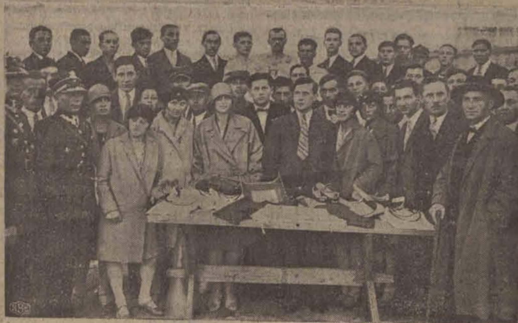
Przed rozdaniem nagród.