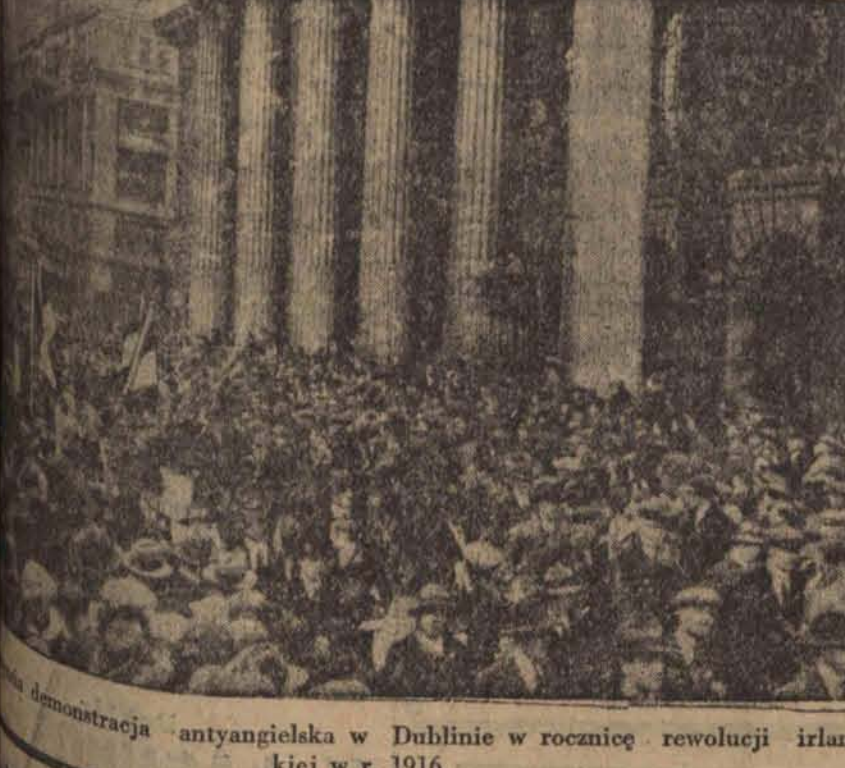
demonstracja antyangielska w Dublinie w rocznicę rewolucji irlandzkiej w r. 1916.