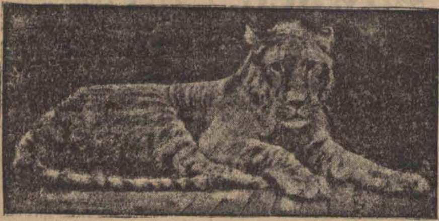
Tygrysolew, mieszanina tygrysa i lwa, okazuje nadzwyczajną dzikość.