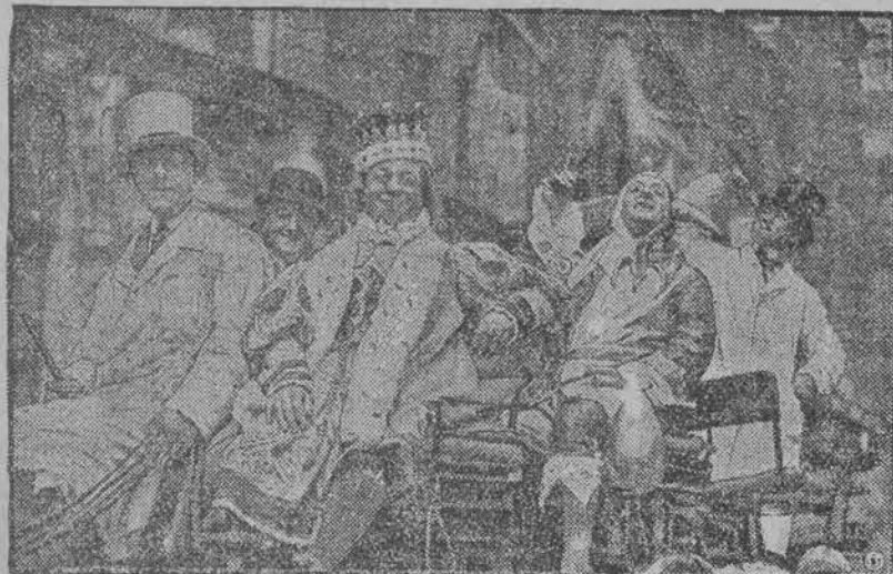
Tak wyglądał tegoroczny król nicejskiego karnawału. A jak będzie wyglądał król karnawału łódzkiego?