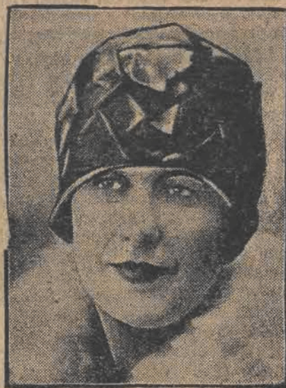
zrzekła się wszelkich praw do swego przyjaciela, króla rumuńskiego Karola za 350.000 dolarów.