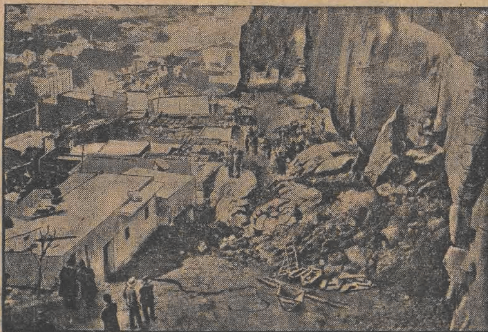
W Algierze miała miejsce wielka katastrofa — olbrzymia góra obsunęła się, zasypując całą dzielnicę. Dotychczas z pod gruzów wydobyto 60 trupów.