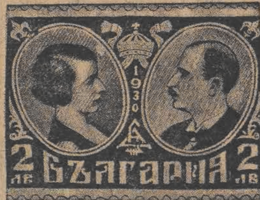
Z okazji zaślubin króla Borysa, poczta bułgarska wydała nową serię znaczków wartości 2 lewów z podobiznami króla i królowej.