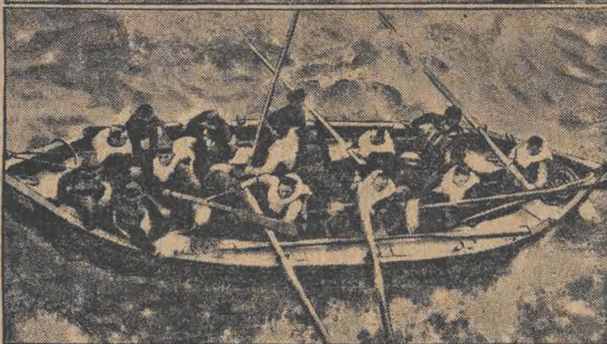
Statek grecki „Theodoris Bulgaris” (u góry) został uszkodzony w zatoce biskajskiej i zaczął tonąć. W ostatniej chwili pośpieszył mu na ratunek, wezwany sygnałami „S. O. S.” angielski okręt „Viceroy of India”, który zdążył uratować całą załogę (u dołu).