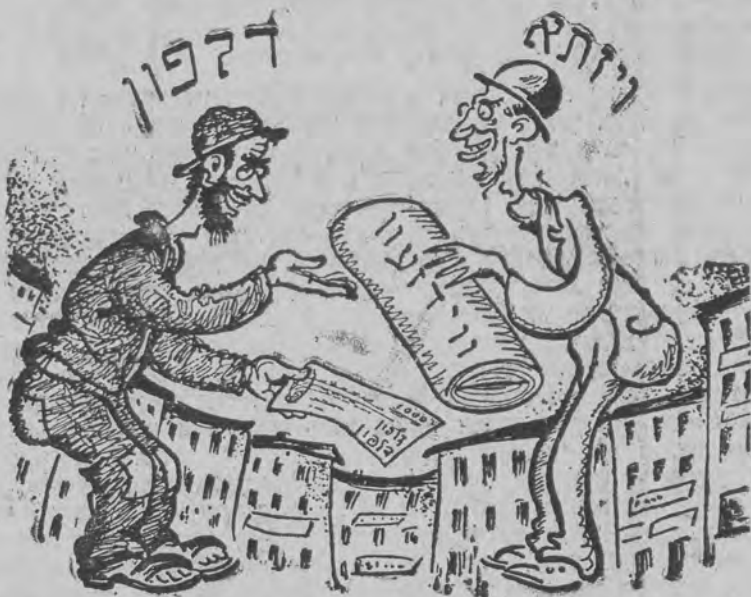
נאר א ריזא קאן איצט געבען סחורה דלפונען אויף א וועקסעל...