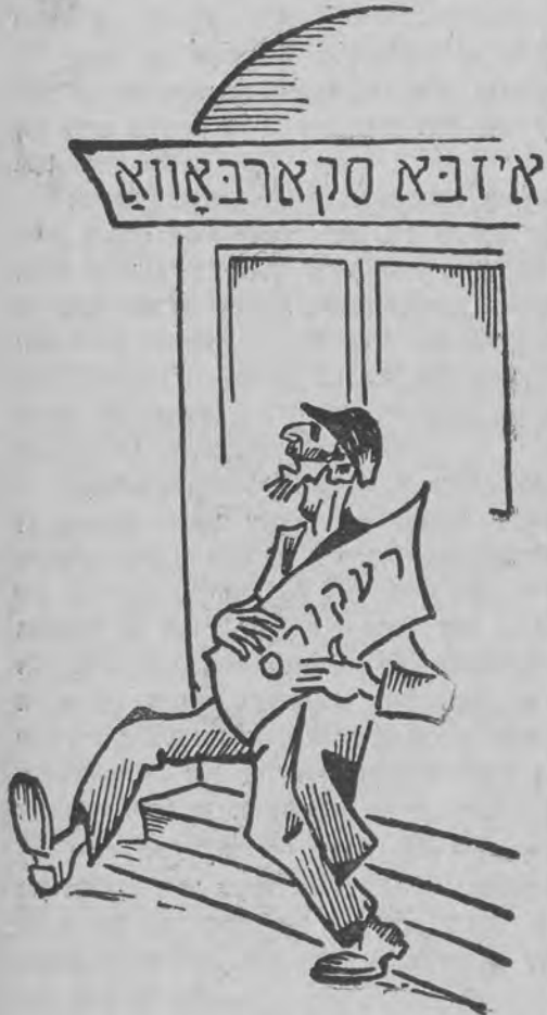
אזוי לויפט ער, בעבעך, ארום הין און צוריק.