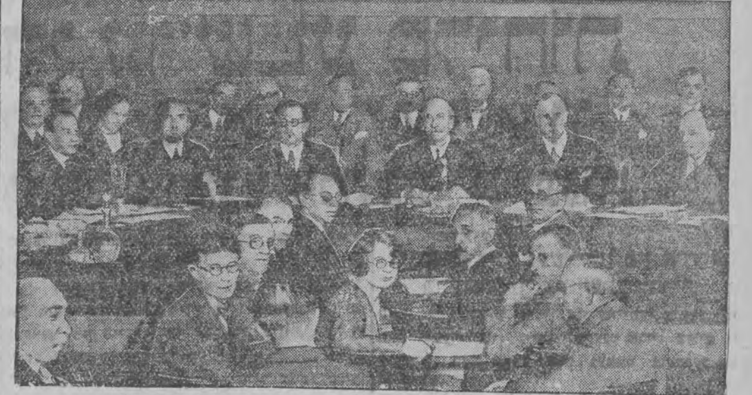
די ערעפנונגס-זיצונג פון פעלקער-בונד-ראט אין גענף

געבן, 6 (ספ. טעל.) מארגען מאנטאג וועט אונטערגעשווענקט געווארען און א גאנצע רייה דיפ- לאמאטען.