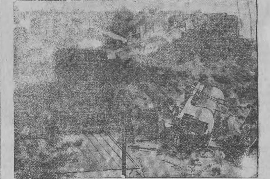
37 צייטערנעם זענען אראפ פון די שינעס די שיק, א'מיראנטע צעטארע, אויף וועלכער עס איז אויסגעבראכען דער אויפשטאנד פון די מאטראצען