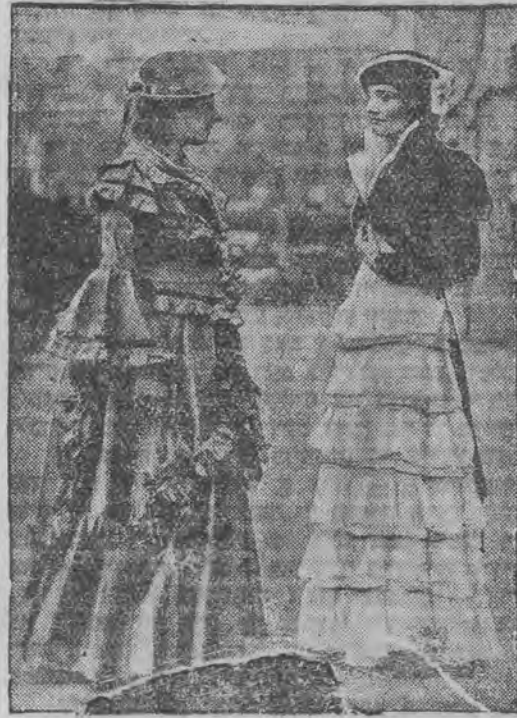
פון א מאדע-רעווי אין לאנדאן