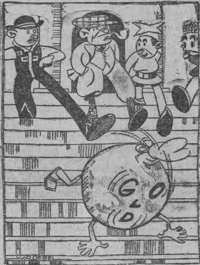
דאס גאלד האט זיין מליכט געטון, דאס גאלד קען געהן