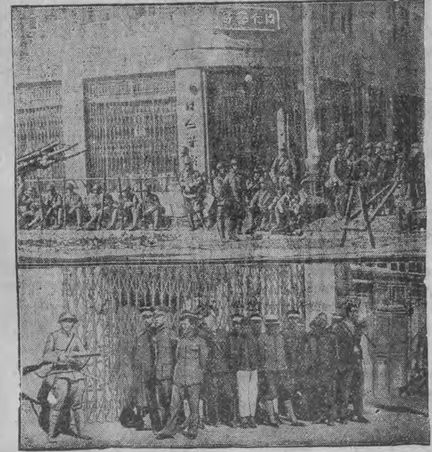
רעכטס, אויבן: 'יאפאנישען טיילטער אויף די גאַסען פון מוקדעז. אונטער: די ערשטע געפאַנגענע