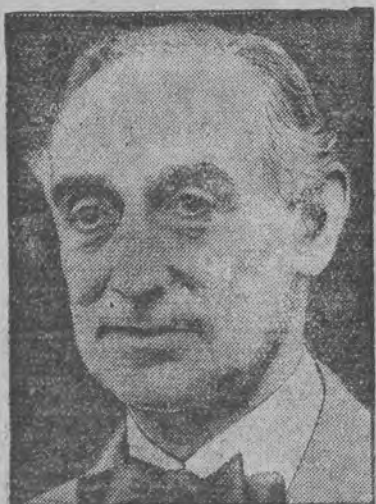
דער ענגלישער איסערן-מיניסטער אין נעפארען קיין פאריז.

די נייע גרופע ביי די ליבעראלען וואס דוואן סימסאן האט געשאפען, צעהלט 22 העפטאטען פון דער צאל 58. די דאזיגע גרופע האט בעסטען אפגעהאלטען א זיצונג און האט בעשלאסען צו שטיצען מאקדא-נאלדן ביי די וואהלען. לאדו. 6. (פאט) ווי מען גיט איבער, וועט דער נייער פארלאמענט געעפענט ווערען דעם 19-טען נאוועמבער.