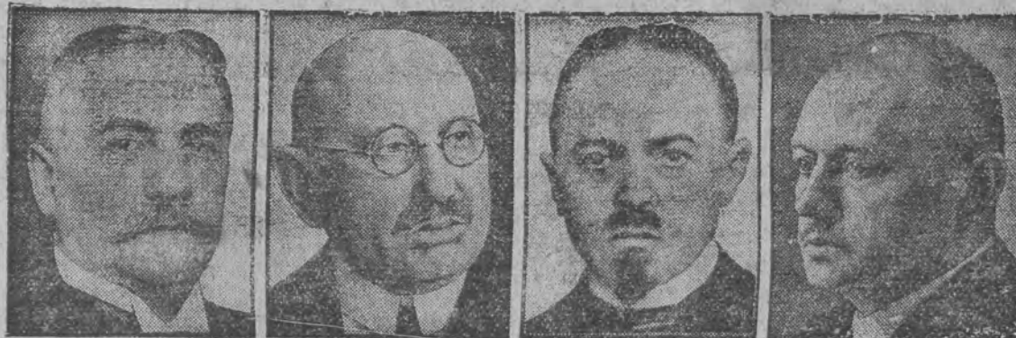
שילע | שטענערואלד | ווארמבאלד | שעצער