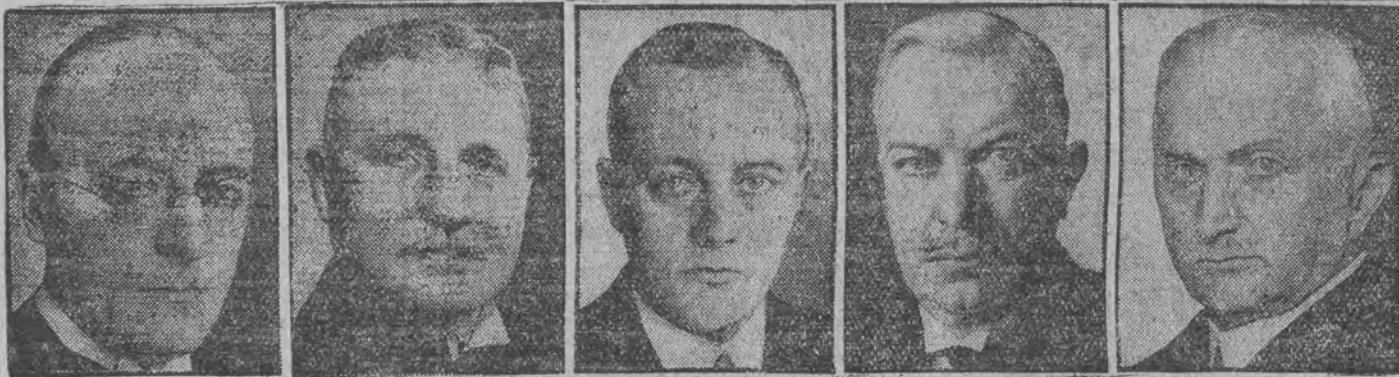
בריינג | גרענער | שוועד | דימירק | יאעל