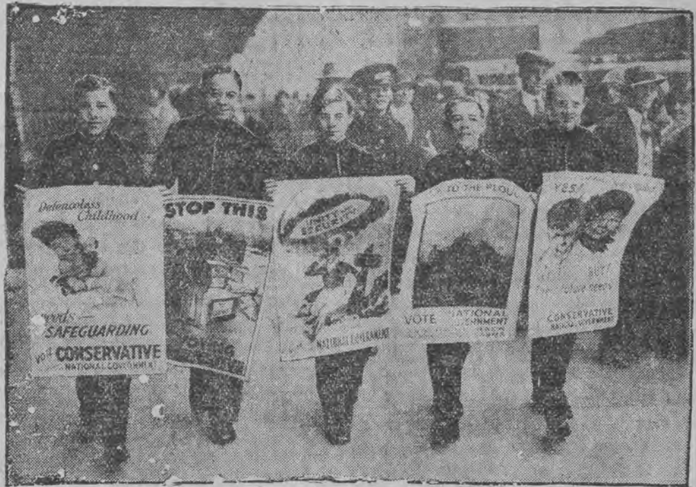
א צוג פון יוגענדליכע מיט וואהל-פלאקאטען פון ד' האנסערוואטיווע

ירושלים (י"א) לויטן אפיציעלען בעריכט האבען די הכנסות פון דער ארץ-ישראל-רעגירונג פאר די ערשטע 7 חדשים פון יאָר 1931 געטראפען 1,339,883 פונט, די הוצאות פאר דעם זעלבן פעריאָד האבען געטראפען 1,288,827. עס איז דער ריבער דערגרייכט געווארען אַנאָפערשום פון די הכנסות איבער די הוצאות.