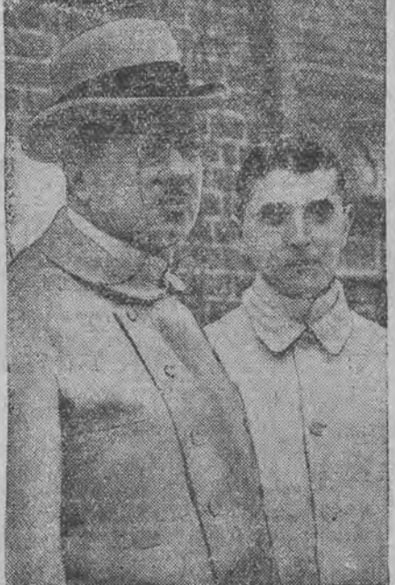
דער הויפט-בשולער, פראָז. דעיקס (לינק) אין דער בעשולדיגטער ד"ר אלטשטערט.

אין ליבעק האָט זיך אָנגעהויבען דער סענסאַציאָנעלער פראַצעס געגען אייניגע דאָקטוירים סאָר שלעכט אָנווענדען דעם קאַלמעט-פרעס דאָ אין אַ קינדער-שפיטאַל פון וואָס עס זענען געשטאָרבן עטליכע צעהנדליג קינדער.