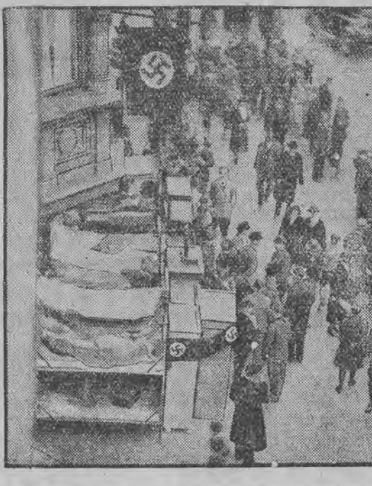
בערלינער פאליציי ווארט ארויס די נאציאנאל- סאציאליסטישען פון זייער היים.