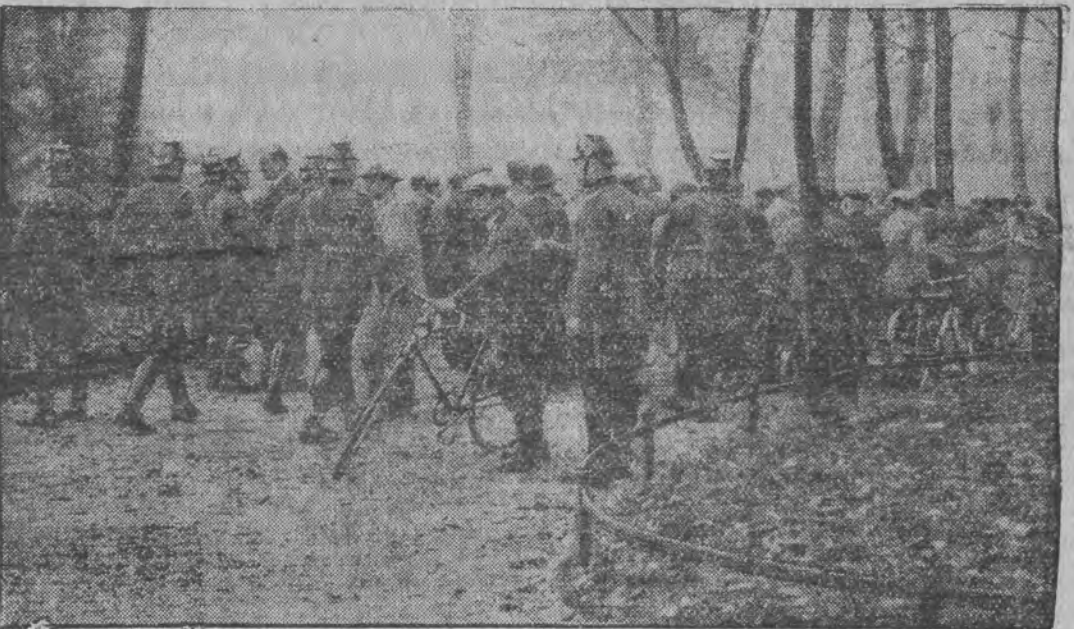
שטארקע פאליציי-אפטיילונגען היטען אָם די געביידע פֿון רייכסטאג און די ארומיגע גאסען