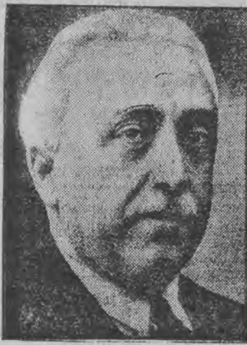
אדאָלפֿו סוואַראַ בילדעט דעם נייעם קאבינעט