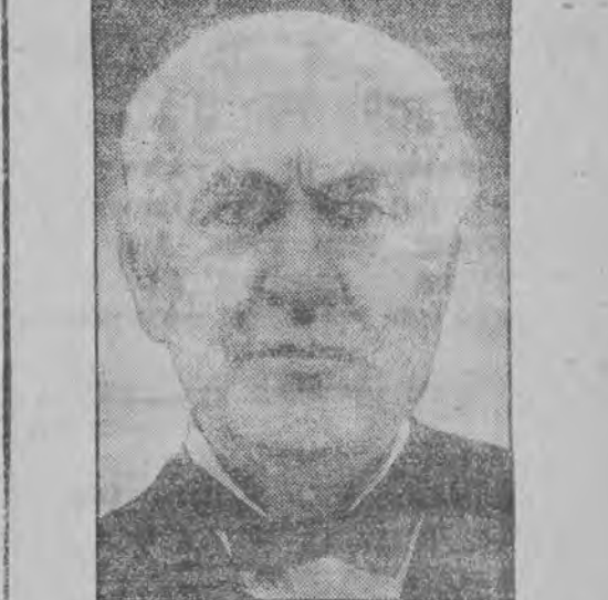
דאָס יאהרהונדערט פון עדיסאזען. ער איז דער פֿאַך טישער גרינדער פון דער מאָדערנער אינדוסטרי, כּמעט אַלע גרונד-פֿאַקטאָרען פון אונזער וואַל-שטאַנד האָבען זייערע אָדער אונזערע צו פֿע-דאָקען זייער אַנצוהאַרפֿען.

וואָס די מענשהייט האָט צו פֿערימאָסטען עדיסאז גען, דאָס האָט צום בעסטען אויסגעוויקלט זיין אַל-טעו פֿריינד און שילדער הער פֿאַרד, "סידען, האָט ער געזאָגט ווענען עדיסאזען, ערגיץ אין אַ וויסען מד-בו, וואָס מען געפֿענען אַ מענשען, וואָס זאל באַרױשט האָבען צו פֿערימאָסטען עדיסאזען, אָבער אומעסום, וואו עס איז פֿערימאָסט צו ציוויליזאַציע, דאָרט שוועבט עדיסאזען שטאַטען, אונזער יאהרהונדערט איז אָנגענו-מען אַנצוהאַרפֿען דאָס יאהרהונדערט פון דער איי-זעסטייער, רייכטער וואָלט געווען עס אַנצוהאַרפֿען