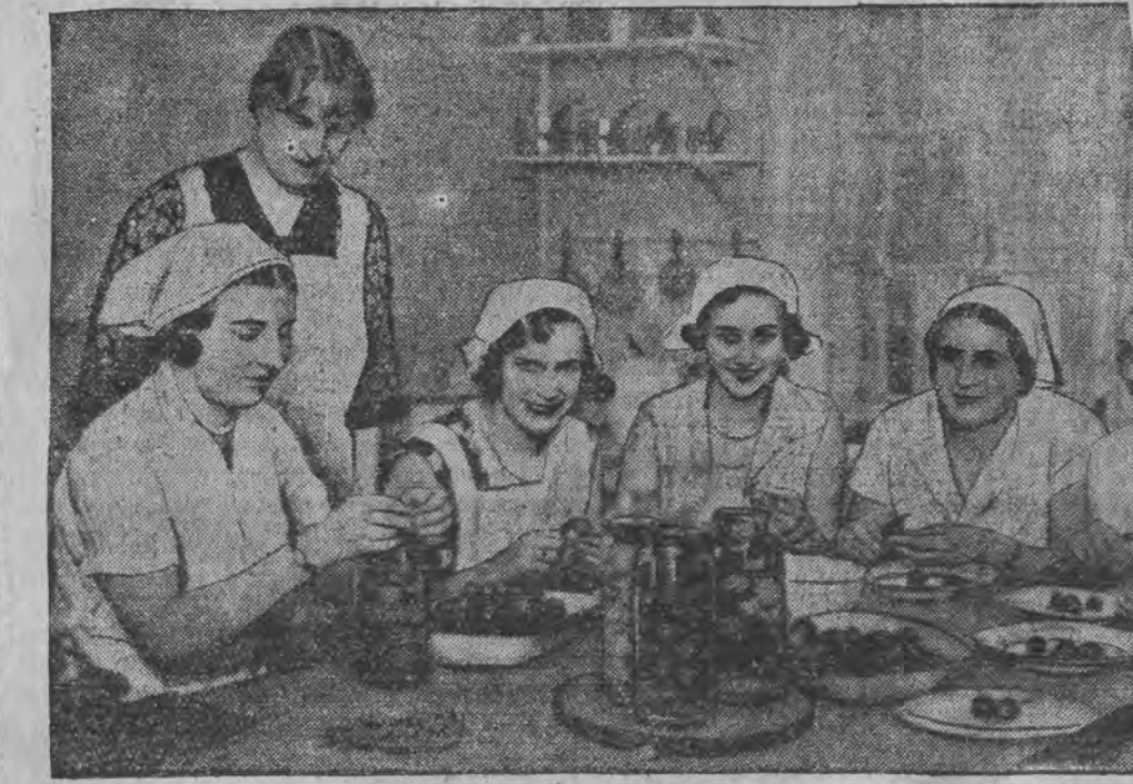
פרינצעסין איננריד פון שוועדען (לינקס) לערנט זיך מאכען קאנפיטורען