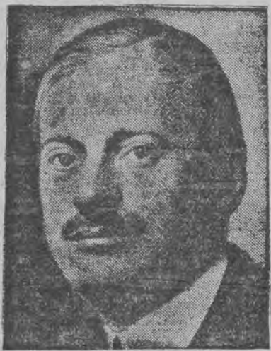
האט זיך אפגעזאגט פון דער לייטונג פון דער עסטרייכישער קרעדיט-אגסטאלט (אינגע פון די גרעסטע בענק אין עסטרייך)