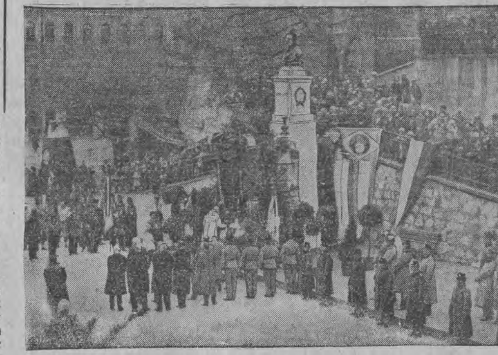
אין מייערליך אפגעזעט געווארען אין קיפטיין אויף דער בייזישע עסטייכישער גרעניץ