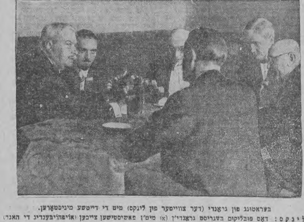
בעראטונג פון גראנדי (דער צווייטער פון לינקס) מיט די דייטשע מיניסטערן. לינקס: דאס פובליקום בערויסס גראנדי'ן (א) מיטן פאסיסטישען צייכען (אויסווייבערדיג די האנד)