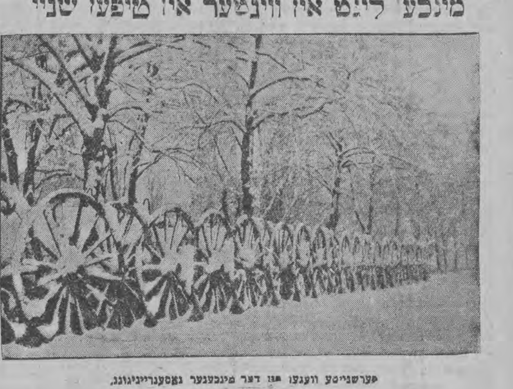
פערשניטע ווענען פון דער מינכענער נאטורלייגונג.

די געליבטע האָט אָבער טיף געליטען און אַ ריינגעפאלען אין א מרה שחורה אָבער פונקט אַזוי ווי סאביאַס עלטערען האָבען נישט געפינגען זי. ער טאָטער און בעצייכען זיך צו איהר מיט פולען צוטריי אַזוי פונקט האָט מען מיקאלאָען שטאַרק צעראַיווירט אין דער היים. זיבן עלטערען געווען זענען ער צייט האָבען איהם פאָרזעל פערווערט זיך צו זעהן מיט דער יודישער.