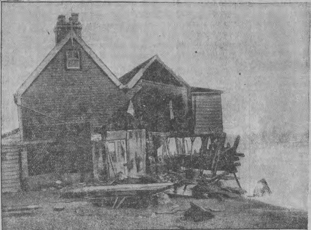
פערוויסטונגען פון שטורעם ביים ברעג פון ענגלאנד