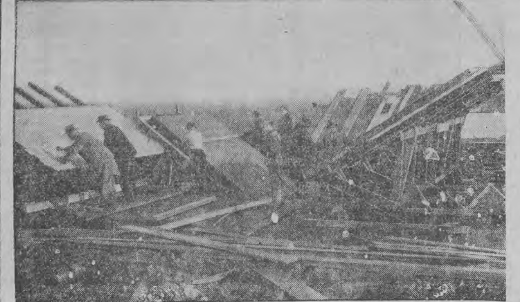
אין א פאַרשטאָט פון בערלין ווערען אויפגעשטעלט היינער פאַר די וואַלען, וואָס דאָס אויסשטעלען ווערט דאָרפן 4 טאָג.