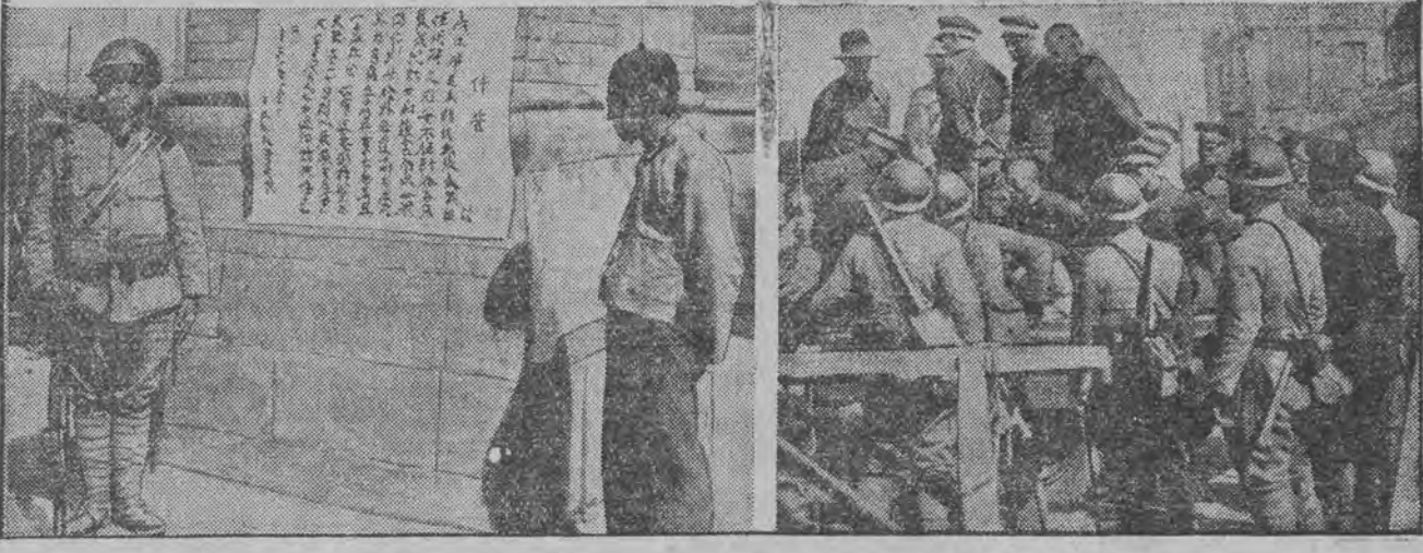
אויבען, לינקס: קייזער פו-זשי האט געזאלט מיט דער הילף פון די יאפאנער פראקלאמירט ווערען אלס קייזער אין מאנדזשוריען און איז פלוצלינג פערשוואונדען געווארן. אונטען, לינקס: פלאקאטן פון דער יאפאנישער אקופאציע-ארמע, אויבען, רעכטס: די בריק איבער'ן טייך נאנגי, ארום יעלכען עס זענען געפיהרט געווארען סטארקע קאמפען. אינטען, רעכטס: יאפאנער טראנספארטירען כינעזישע געפאנגענע.