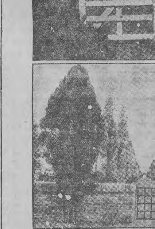
איין בית עולם פון דיימשע נעפאלענע זעלנער אין צפון-פראנקרייך

מיר וועלען געהען מיט יעדען וועלכער וועט אויף א לעגאלע וועג זיך בעמיהען צו בעקעממען די רע-בערינג.