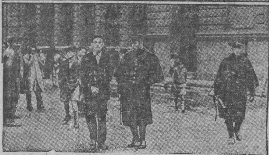
איבען: נעשלאסענע געשעפטען אין מאדריד. אונטען: ארעסטירטע סטודענטען

ל' טבת, 23 (פאט. טעל.) א גרויסע בע- וואס בין מארגען מיטוואך דארף ענגלאנד דעקען אונרוהיגונג האט ארויסגערופען די נייע יודישע די אימפארט-סערפליכטונגען מיט גאָלד. ס'זענען שטערלינג. ס'זענען שטערלינג. ס'זענען שטערלינג.