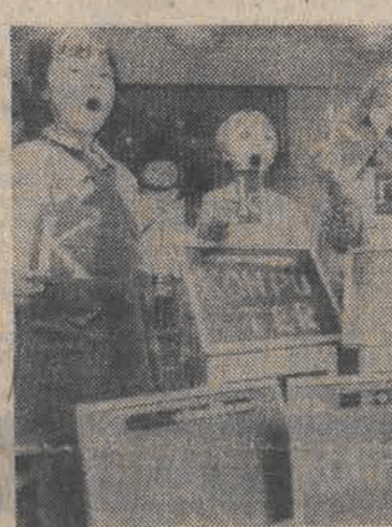
Sześciolatki pozostają w centrum zainteresowania. Za kilka miesięcy rozpoczyna naukę w nowej, zreformowanej szkole dziesięciolatkowej. Teraz w przedszkolu przygotowują się już do roli ucznia. Na zdjęciu: klasa zerowa w warszawskim przedszkolu przy ul. Sobieskiego.