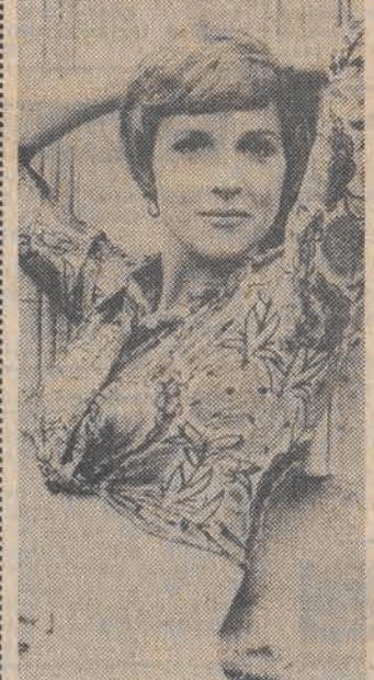
Julie Andrews należy do najznakomitszych gwiazd komedii muzycznych na Broadwayu...