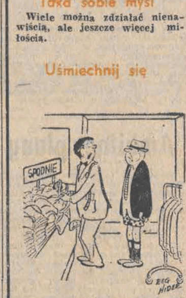
- Czy jest pan absolutnie pewny, że właśnie w tym stroju nie wszedł pan do naszego sklepu?