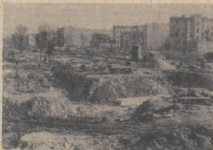
Tak wygląda skrzyżowanie ulic Głównej i Sienkiewicza. Ogrom prowadzonych tu robót - aż nadto widoczny...

Z dnia na dzień powiększa się gigantyczna dziura, jaką wykopano w centrum Łodzi w związku z realizacją największej w historii miasta inwestycji drogowej. Część tej dziury już zagospodarowano, budując wiadukty dwupoziomowego skrzyżowania ulic Żeromskiego i Mickiewicza.