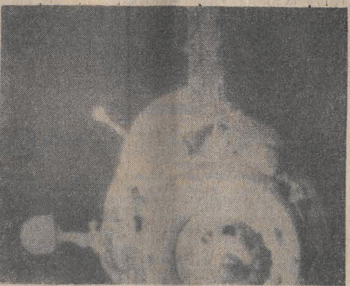
N/Z: PROGRESS-1 oddala się od kompleksu orbitalnego po odlączeniu. CAF — TASS — teletexto.

6 bm. o godz. 3.53 czasu moskiewskiego, po zrealizowaniu programu wspólnego lotu, automatyczny transportowiec kosmiczny „Progress-1” został odlączyony od zespołu orbitalnego „Salut-6” — „Sojuz-27”.