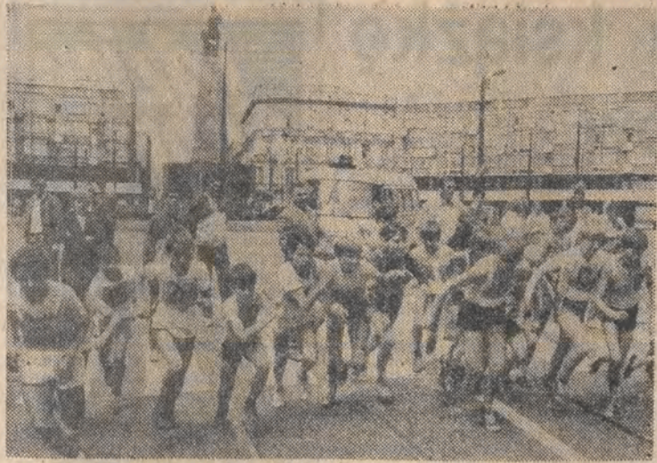
(Dokończenie ze strony 1)

Dwie orkiestry hucnie grały im na powitanie — tramwajarska i harnamowska. Po pewnym czasie cały korowód z muzyką ruszył z placu Wolności w Piotrkowską — aż do alei Schillera. I dopiero tam — kiedy wszyscy zaprezentowali się w całej okazałości przed liczną zgromadzoną publicznością — okazało się, że to uczniowie z: XV Liceum Ogólnokształcącego i Zespołu Szkół Włóknienniczych nr 2 w Łodzi oraz Zespołu Szkół Mechanicznych nr 2 w Pabianicach, którzy tak pięknie pomyślną i zorganizowaną paradą w strojach popularnych postaci filmowych (bo Łódź przecież to stolica polskiego filmu) zaakcentowali swój udział w święcie.