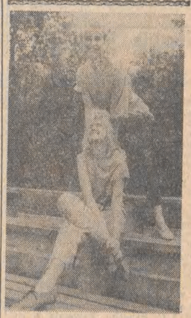
Na wakacyjnym luzie.

Obecnie trudno powiedzieć, jakie skutki bezpośrednie przyniesie susza zanieczyszczenia ozonowej w atmosferze ziemskiej, jak również coraz to nowe szkodliwe substancje przedostające się w stale wzrastających ilościach do atmosfery ziemskiej. Jest sprawa jasna, że o ile szkody w środowisku nie zostaną zahamowane, to szkody dla życia na ziemi są wprost nie do przewidzenia.