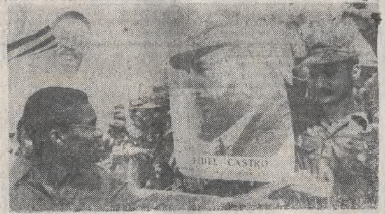
ANGOLA. Pierwsza grupa żołnierzy kubańskich opuściła Angolę. N.z.: pożegnanie na lotnisku w Luandzie.

W odpowiedzi na krążące na ten temat pogłoski dziennikarza PAP poinformowano w Dyrekcji Generalnej PKP, że nie przewiduje się zniesienia tzw. miejscówek w pociągach ekspresowych kursujących na liniach krajowych. Rezerwacja miejsc, choć kłopotliwa nieraz dla klientów, gwarantuje jednak w miarę wygodne warunki podróży. W dodatku, od niedawna, czynne są już na wielu dworcach kolejowych i w biurach podróży kasy elektroniczne znac-