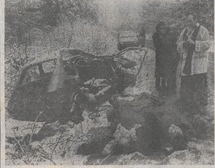
W konkursie im. Stanisława Dąbrowieckiego dla fotoreporterów CAF, zdjęciem roku wybrane fotografię Krzysztofa Świderskiego „Ostatnia droga”.