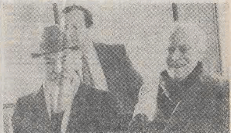
Wczoraj na zaproszenie Centrum Sztuki Studio przybył do Warszawy światowej sławy skrzypek i dyrygent Yehudi Menuhin. 16 bm. orkiestra Sinfonia Varsovia pod dyrekcją Yehudi Menuhina wystą-

Doniosłym rezultatem konferencji paryskiej, który odnotowano w deklaracji, stało się wskazanie na konieczność zawarcia w najbliższym czasie konwencji o zakazie opracowywania, produkowania, gromadzenia i stosowania wszystkich rodzajów broni chemicznej i o jej zniszczeniu.