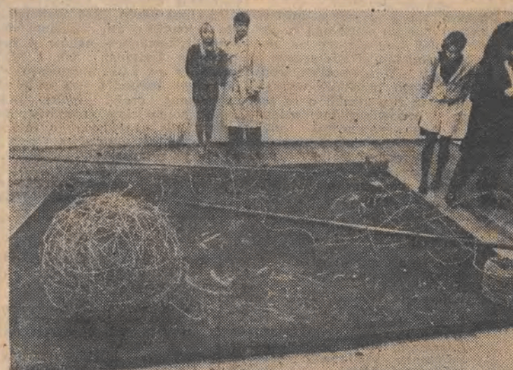
W Muzeum Historii Miasta Łodzi otwarto wystawę angielskiej grupy artystów-plastyków „Byam Shaw School of Art”.