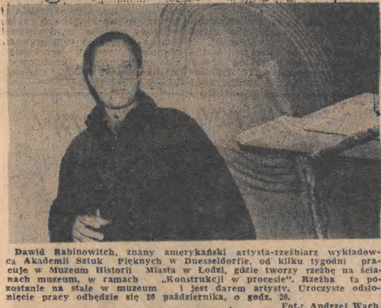
Dawid Rabinowitch, znany amerykański artysta-rzeźbiarz wykładowca Akademii Sztuk Pięknych w Dusseldorfie, od kilku tygodni pracuje w Muzeum Historii Miasta w Łodzi, gdzie tworzy rzeźbę na ścianach muzeum w ramach „Konstrukcji w procesie”. Rzeźba ta powstanie na ścianie muzeum i jest darem artysty. Uroczyste odsłonięcie pracy odbędzie się 20 października, o godz. 20.