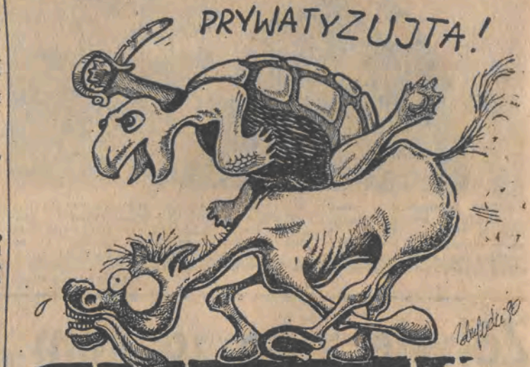
Rys. Piotr Zdrzyński