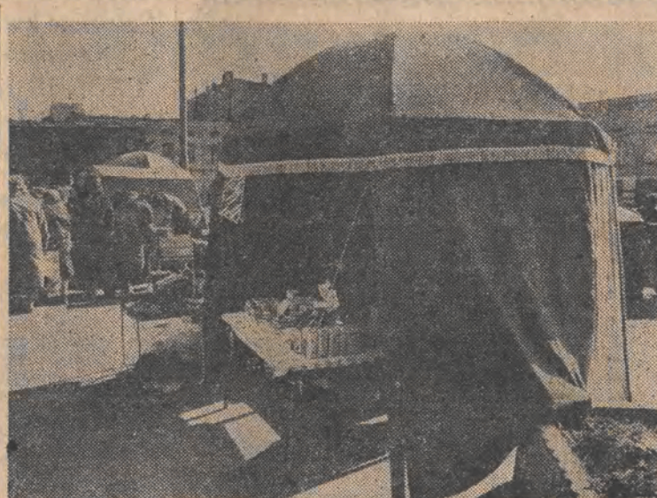
Sprzedawcy, na pl. Barlickiego korzystają z takich namiotów.

orkiestry „Bach-Collegium” (powstanie koncertu we środę o tej samej porze). Później oglądać będziemy m.in. Stuttgart w fotografiach, zaprezentują się zespoły „Vaseline Joystick” i „Toaster” (rock, beat, punk, swing, country, jazz), a „Materialtheater” przywiezie „Korowód występów” według F. Villona.