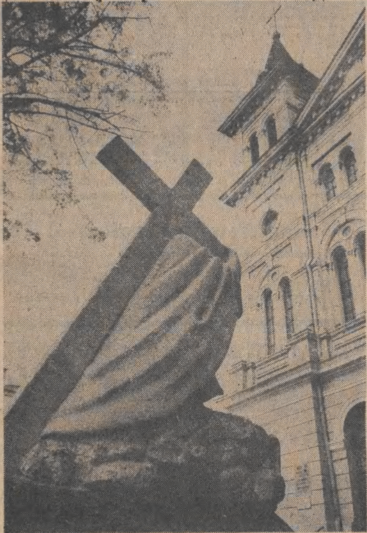
Postać Chrystusa z krzyżem przed kościołem św. Ducha w Łodzi.

Łódź dziewiętnastowieczna była dla Królestwa Polskiego „ziemią obiecaną” głównie dzięki bawełnie. Czy dzisiaj, po stu latach ówczesnej łódzkiej prosperity, nie powinniśmy poprosić o powtórzenie tego bawełnianego cudu? Byłoby to jak najbardziej w czasie, jeśli zważyć, że łódzki przemysł bawełniany pograżył się w takiej recesji, że przedłużenie się tego stanu grozi już tylko lawiną upadłości wielu zakładów, a więc utratą pracy dla wieloletniejszej rzeszy łódzkich włóknarzy. W moim przekonaniu takie szanse istnieją. Logikę swych przemyśleń opieram na osobistych doświadczeniach i spostrzeżeniach.