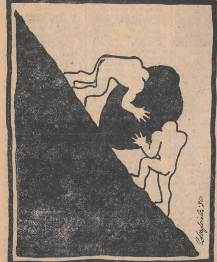
Rys. Piotr Zdrzyński

Wczorajsze ceny (godz. 7), na pl. Barlickiego: Kapusta biała - 800 zł piekarni - 9.000 zł, ziemniaki - 400 zł, 1 jajo - 690 zł, marchew - 1.000 zł, podgrzybki - 12.000 zł, szalata - 800 zł, kalafior (duży) - 5.000 zł. Kurczaki - 14.500 zł, nóżki wieprzowe - 6.000 zł. Cukier - 4.500 zł, sól - 1.200 zł, mąka poznańska - 2.800 zł, ryż - 6.000 zł, mleko „Bebiko 2R” - 8.000 zł. Rajstopy damskie - 4.500 zł, lalka - imp przyw ZSRR - 35.000 zł. „Alfabet Urbana” - 24.000 zł. Handlujących na pl. Barlickiego coraz mniej. Ceny od tygodnia utrzymują się na tym samym poziomie.