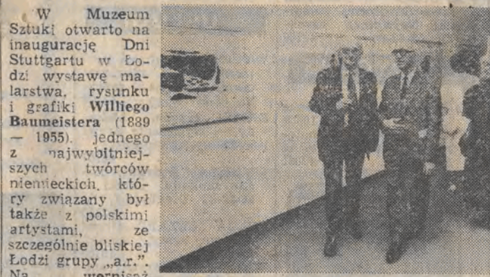
W Muzeum Sztuki otwarto na inaugurację Dni Stuttgartu w Łodzi wystawę malarstwa, rysunku i grafiki Williama Baumeistera (1889-1955)...