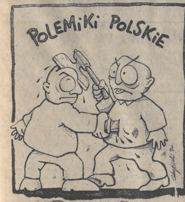
Rys. Piotr Krawczyk