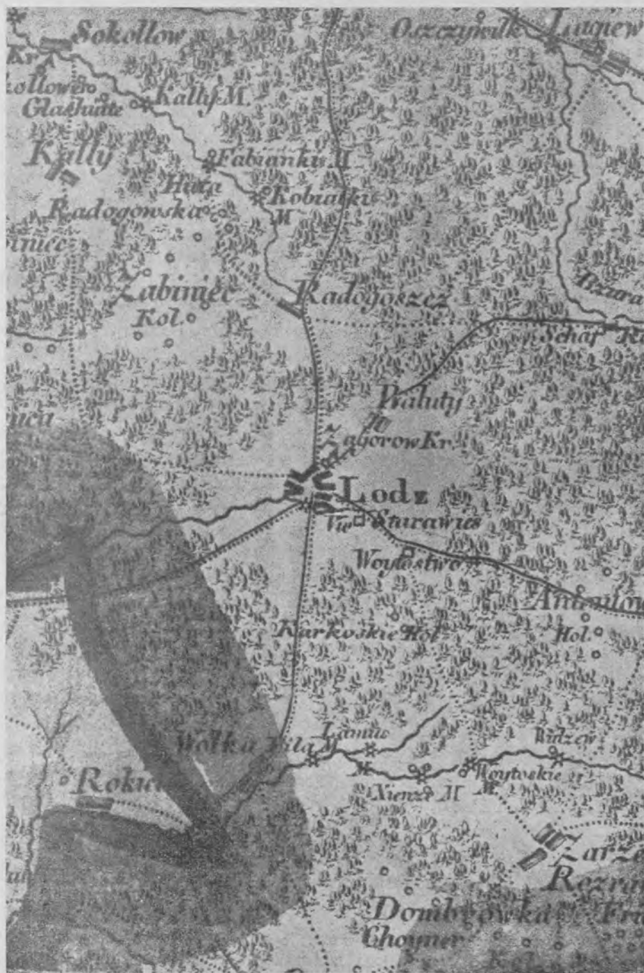
Wycinek z mapy Gilly'ego, Specialkarte von Süddeutschen (1802—1803).