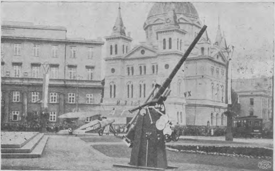
Plac Wolności w okresie subskrypcji Pożyczki Obrony Przeciwlotniczej. Na pierwszym planie imitacja dział przeciwlotniczego, w głębi samolot na tle kościoła ewangelickiego św. Trójcy.

Pamiętać należy, że do czasów odzyskania Niepodległości ówczesny Nowy Rynek przecinały tory tramwajowe w skrzyżowaniu, prowadzące naprzeciąj rynku od ul. Piotrkowskiej w kierunku Starego Miasta i od ul. Konstantynowskiej w kierunku ul. Średniej dziś Pomorskiej z rozjazdami po środku Nowego Rynku. Inaczej przedstawia się sprawa torów tramwajowych