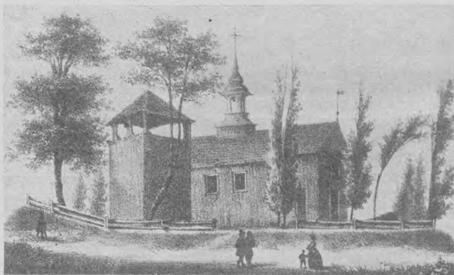
Kościół N. M. P. na Starym Mieście w Łodzi. Sztych z r. 1853.