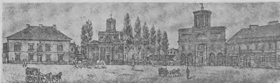
Pierwotny wygląd Placu Wolności, dawnego Rynku lub Nowego Miasta w Łodzi.

Po przeprowadzonej przez Rembalińskiego regulacji Nowego Miasta, a więc nowej dla odróżnienia od starej Łodzi, zmieniła się konfiguracja tego placu. Począł on nabierać już wówczas charakteru do pewnego stopnia reprezentacyjnego, reprezentacyjnego dla tego właśnie, że na plac Nowego Miasta został przeniesiony urząd municypalny Łodzi — magistrat. Daw-