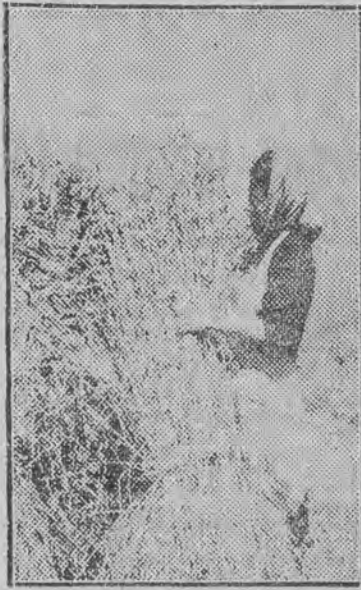
Ostatni snop do kopy

Uczynięm zażość życzeniu elektryków, napisania wyjątkowo o nich kilku słów. Z. K.