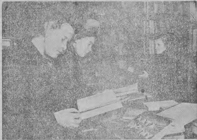
W związku z Miesiącem Pogłębiania Przyjaźni Polsko - Radzieckiej moskiewskie księgarnie stwierdzają znaczny wzrost zainteresowania publiczności polską beletrystyką. Na zdjęciu: Księgarnia na „Kuznieckom Mostu” w Moskwie.

Cena 5 zł Łódź czwartek 3 listopada 1949 r. Rok V Nr 303 (1567)