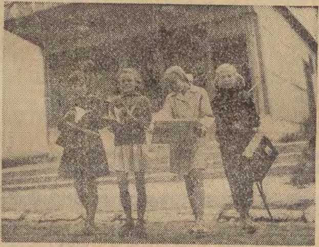
Skoczyły się wakacyjne emocje. Problemem numer jeden jest teraz zaopatrzenie się w potrzebne podręczniki, zeszyty i różne przybory szkolne.