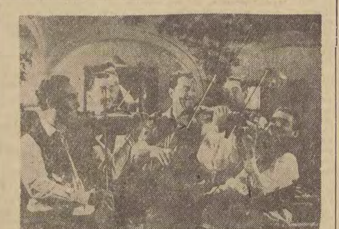
W sobotę, 31 marca i w niedzielę, 1 kwietnia o godz. 19 wystąpi w łódzkiej Hali Sportowej reprezentacyjny Węgierski Zespół Pieśni i Tańca - węgierski odpowiednik naszego „Mazowsza”.