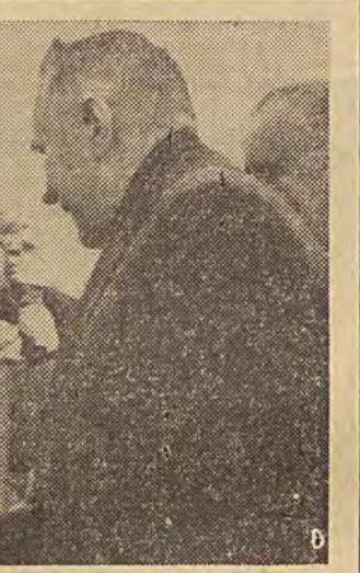
Na zdjęciu: na lotnisku w Tuluzie premiera Kosygina wita tancerka ludowego zespołu tanca, ubrana w strój regionalny. Po prawej (za A. Kosyginem) stoi premier Pompidou.