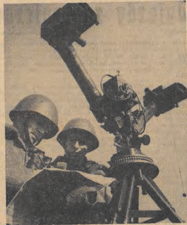
Artylerzyści Ludowego Wojska Polskiego posiadają cały arsenal środków, które umożliwiają im rozpoznanie terenu, określenie celu i obserwację wybuchów. Lorneta nożycowa (na zdjęciu), stanowi właśnie jedną z tych precyzyjnych przyrządów optyczno-mierniczych.