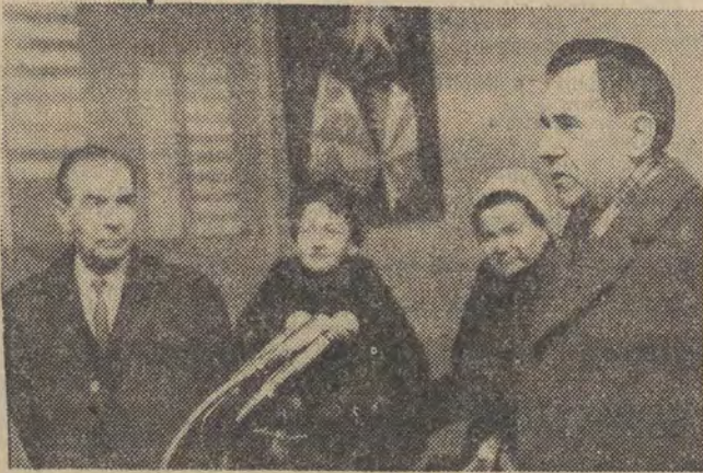
Na zdjęciu: w sali recepcyjnej Dworca Gdańskiego prze mawia min. A. Gromyko. Z lewej — min. A. Rapacki oraz jego małżonka i małżonka min. A. Gromyki