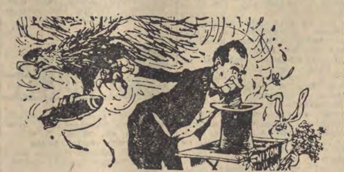
...i, voilà, wyciągamy gołębia... gołębia... no, zresztą wyobraźmy sobie, że jest gołąb!