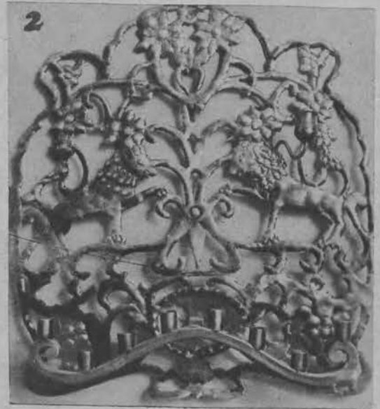
Świecznik ośmio- ramienny