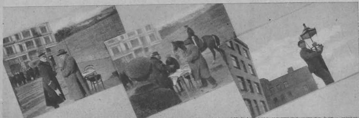
"Wywiabiacz płam" na placu Wolności, cieszył się tak wielkim powodzeniem, że musiał szukać ochrony policyjnej.