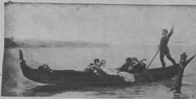
Wilhelm Kotarbiński „Gondola“.